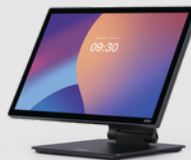
Cashier Stand Pénztár talpazat