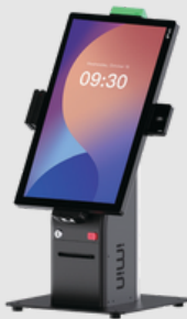
Table Stand Asztali állvány