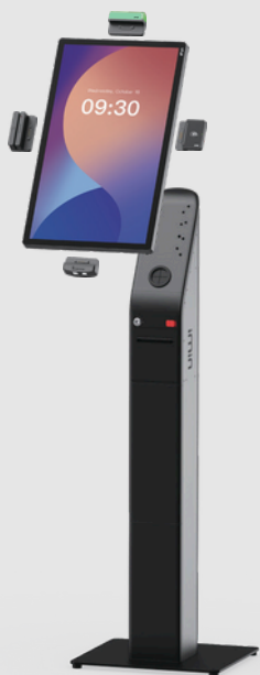
Floor Stand Állvány